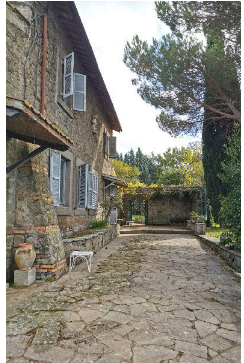
Una villa unifamiliare in vendita nella campagna viterbese

sono grandi proprietà acquistate in passato non più necessarie.